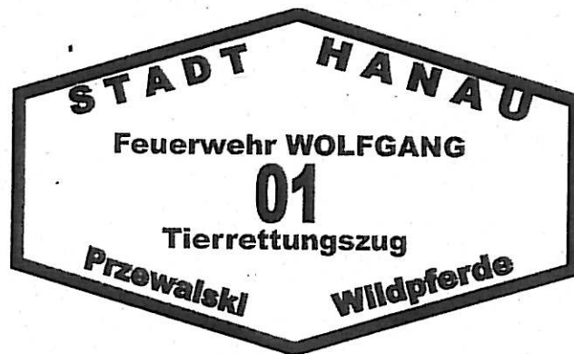
Mit diesem Brandzeichen sollen die seltenen Tiere individuell gekennzeichnet werden.