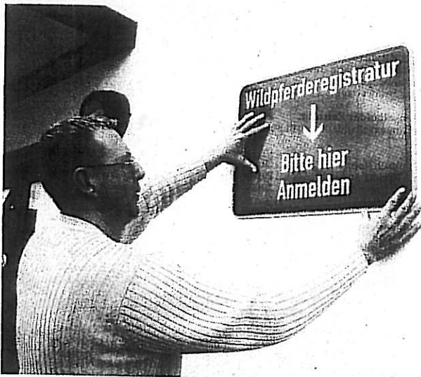
Die Feuerwehr ist gerüstet für die Betreuung der Herde, die bald in Wolfgang eine neue Heimat bekommen soll.