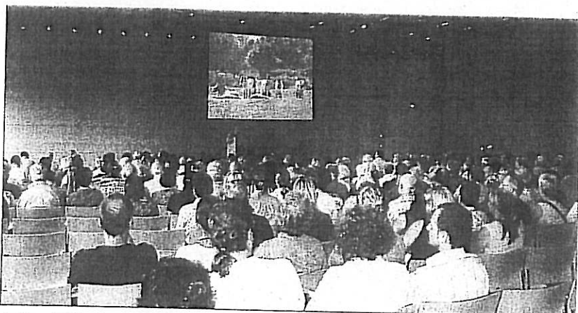
Auf beachtliche Resonanz stieß im Congress Park Hanau ein Informations- und Filmabend über das Przewalski-Projekt.

Przewalski-Pferde sind die Urahnen aller Hauspferde. Pferde sind die ersten Tiere, die von Menschen domestiziert wurden, vermutlich bereits 3500 vor Christus. Die Przewalskis verdanken ihren Namen dem russischen Zoologen und General Nikolaj Przewalski, der 1879 die Pferde am Rande der Wüste Gobi entdeckte. Sie sind die einzige Unterart des Wildpferdes, die in der Wildform bis heute überlebt hat. 1967 wurden die letzten Przewalskis in freier Wildbahn gefangen. Nur 13 der Tiere überlebten in Zoos. Durch ein Internationales Zuchtprogramm ist der Bestand auf 1600 gestiegen. Ein Dutzend Tiere wurden seit 2004 im Naturpark Altyn Emel in Kasachstan ausgewildert.